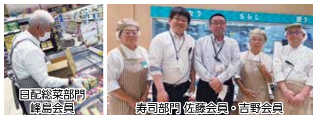
目配総菜部門 峰島会員