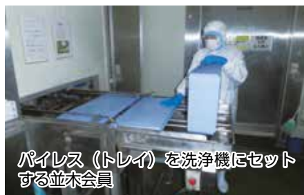
パイレス（トレイ）を洗浄機にセットする並木会員