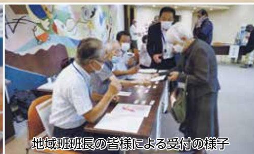
地域班班長の皆様による受付の様子