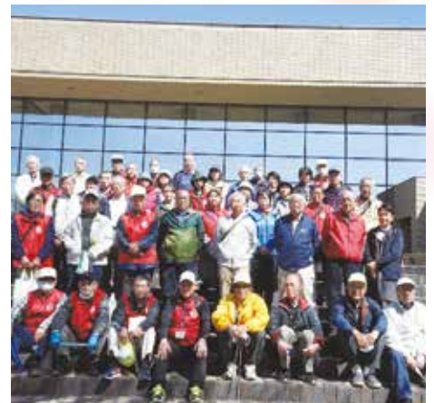
参加した会員の皆様