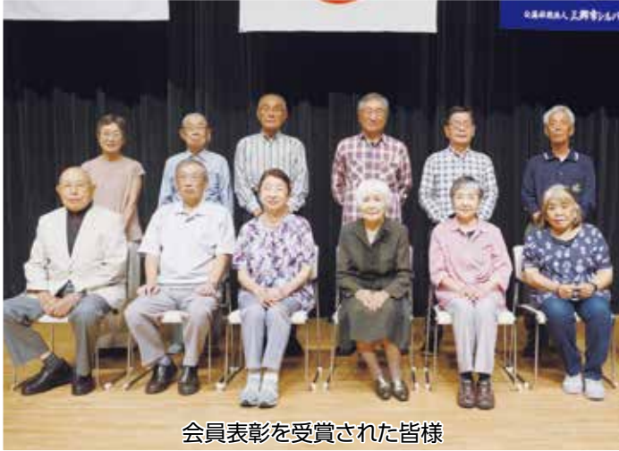
会員表彰を受賞された皆様