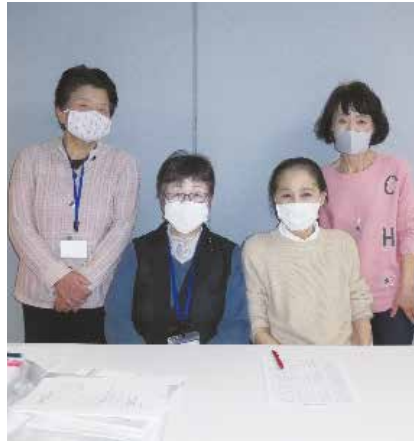
講演会の受付担当の女性班長の皆様