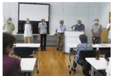
令和5年度の班長・副班長の紹介