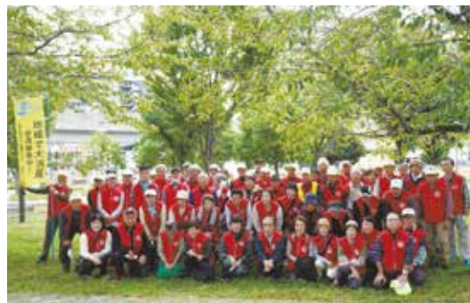
シルバーの日の活動の様子(2022年度)