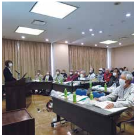
熱心に耳を傾ける会員の皆様