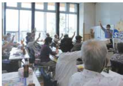
横断歩道を渡る時は手を挙げてハンドサインを